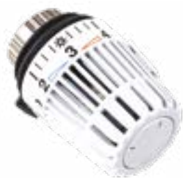
• Robinet thermostatique

Dans un logement, l'entretien des radiateurs est à la charge du locataire. Voici quelques conseils pratiques pour prolonger la durée de vie de vos équipements et réduire les frais de réparation.