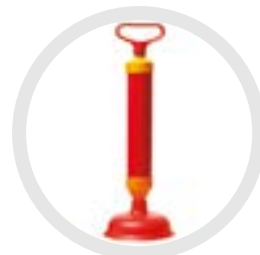
Déboucheur à pompe

Elles peuvent être utilisées si une simple ventouse ne fonctionne pas :