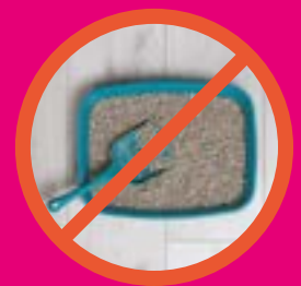
Litière pour chat