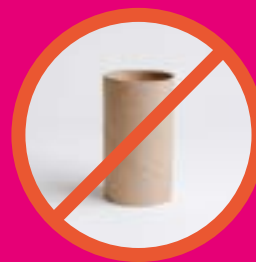
Tube de papier toilette