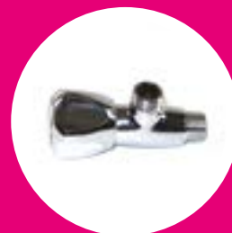
Robinetts d'arrivée d'eau